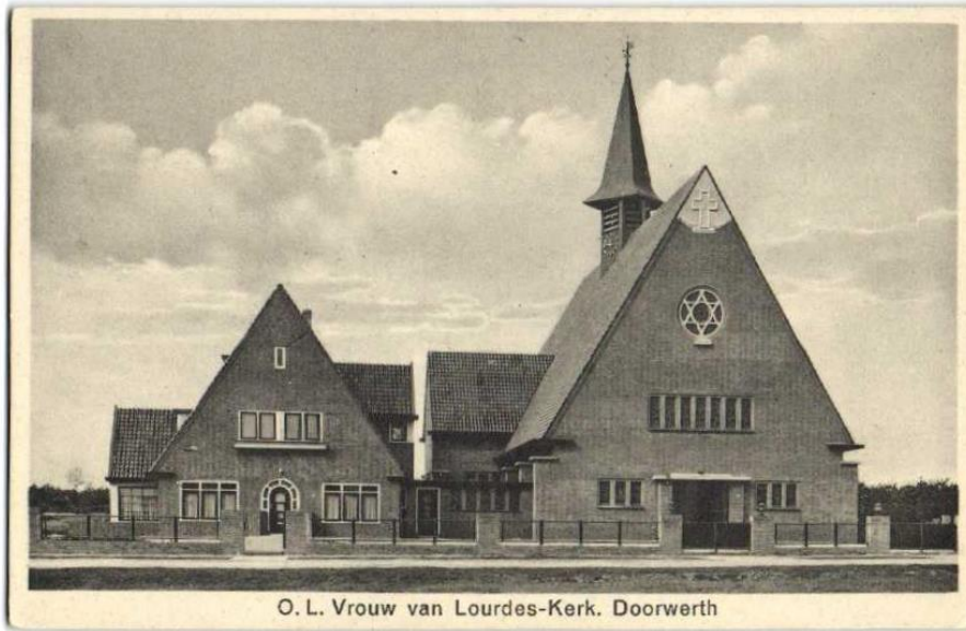
O. L. Vrouw van Lourdes-Kerk. Doorwerth

https://hoogenlaag.nl/lokaal/lourdeskerk-wordt-bed-and-breakfast-432139